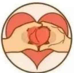
发布虚假爱心 传递诈骗