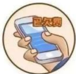
电话/电视 欠费诈骗