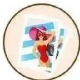
发送“艳照” 进行诈骗