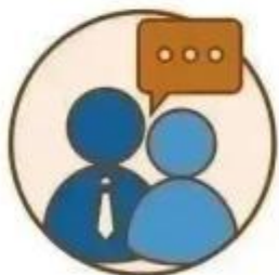
虚构假象 进行诈骗