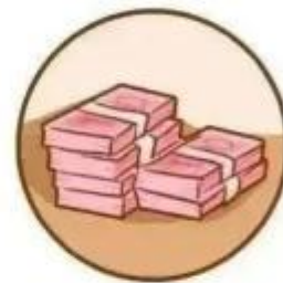
亲友“出事” 急需汇款