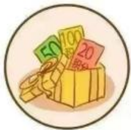
“某公司” 积分兑换礼品