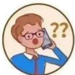
猜猜我是谁? 冒充熟人打电话