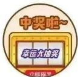
中奖啦! 手机号码被抽中