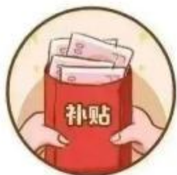
号称机关单位 发放补贴