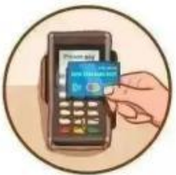
假冒银行提示 刷卡消费